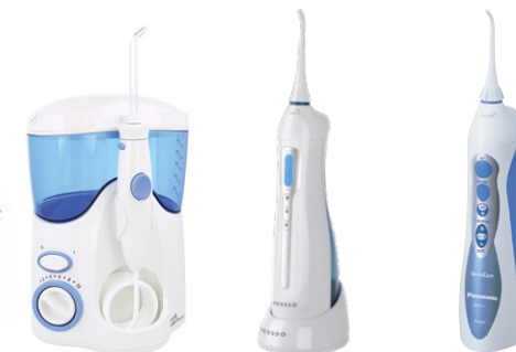
Waterpik WP100 E2 Ultra