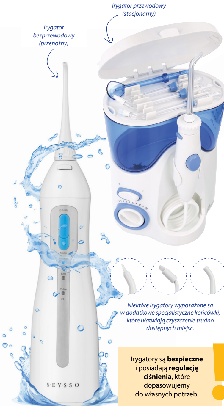
Irygator bezprzewodowy (przenośny)